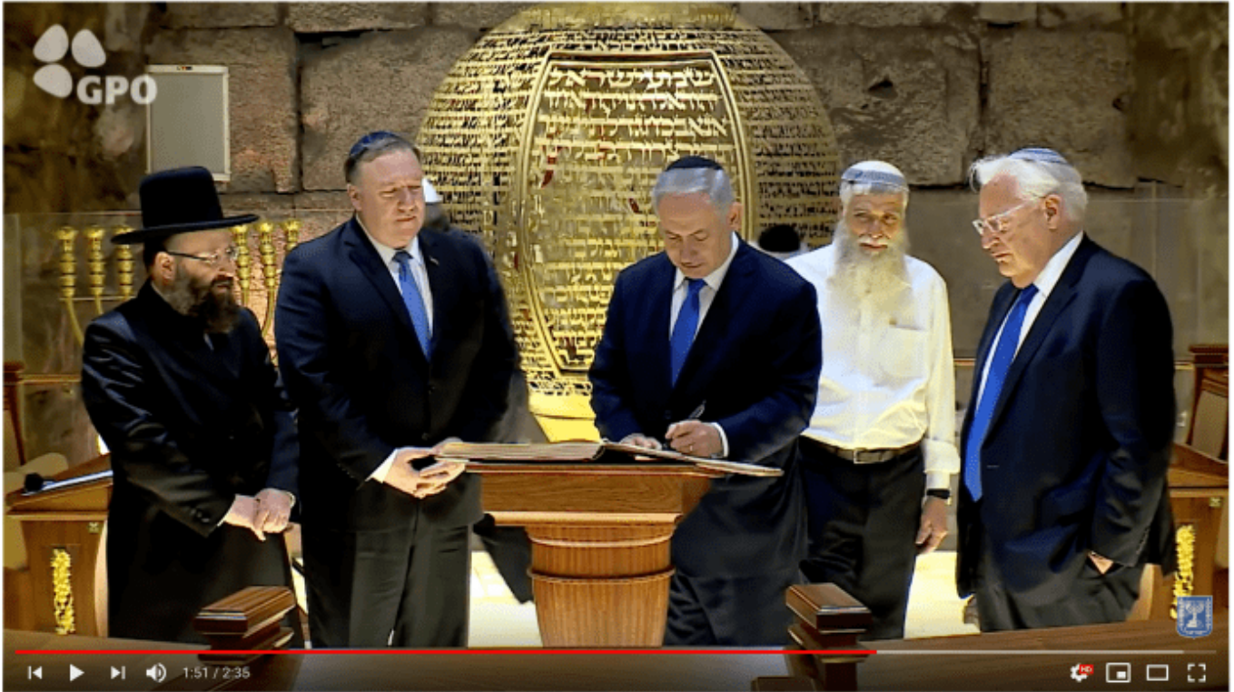
PM Netanyahu and US Secretary of State Pompeo Visit the Western Wall