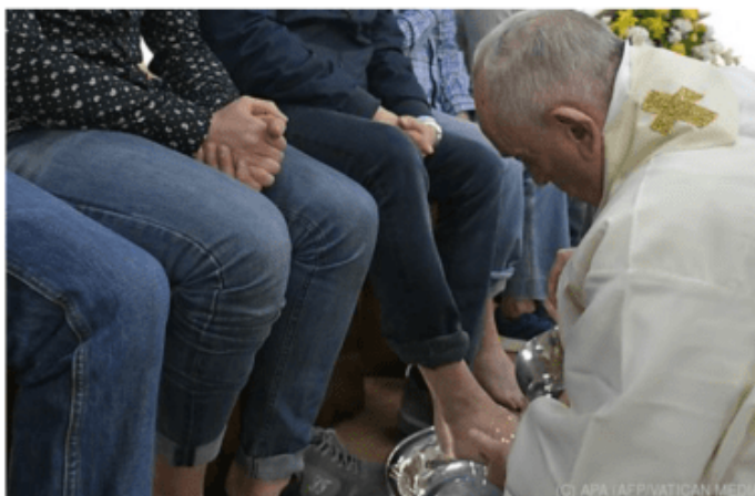
Papst Franziskus in der Strafanstalt von Velletri

Es ist bereits das fünfte Mal, dass Papst Franziskus während seines Pontifikates zur Gründonnerstagsliturgie ein Gefängnis auswählt. Derzeit verbüßen rund 600 Männer in Velletri ihre Haftstrafe, etwa ein Viertel von ihnen sind Ausländer, zumeist Roma, Marokkaner und Albaner.